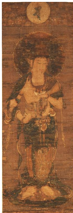
広報用画像② 月天(十二天像の内) 鎌倉時代(13世紀) 奈良国立博物館所蔵 重要文化財 <前期展示>

江戸時代に「日本三奇橋」の一つとして知られた甲府の猿橋を描く。縦長の画面に、橋を見上げ、崖の向こうに遠山や満月を見通す斬新な構図を用いる広重の代表作の一つ。