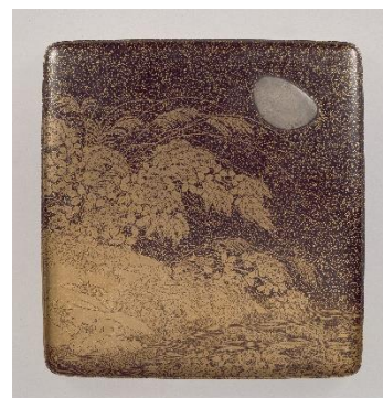
広報用画像③ 萩薄蒔絵硯箱 江戸時代(17世紀) 京都国立博物館所蔵 <全期間展示>

月や月光を神格化した神で、仏教の護法神である十二天のうちの一つ。三日月を戴いた左掌を胸前で構える図像は珍しい。