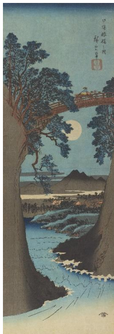
広報用画像① 甲陽猿橋之図 歌川広重筆 江戸時代(19世紀) 太田記念美術館所蔵 <前期展示>

江戸時代に「日本三奇橋」の一つとして知られた甲府の猿橋を描く。縦長の画面に、橋を見上げ、崖の向こうに遠山や満月を見通す斬新な構図を用いる広重の代表作の一つ。